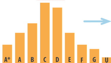
Canlyniadau Cyfartalog y Ganolfan